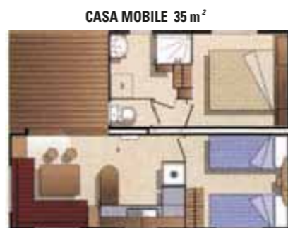
CASA MOBILE 35 m 2