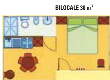
BILOCALE 30 m 2