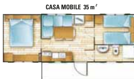
CASA MOBILE 35 m 2