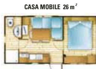
CASA MOBILE 26 m 2

CAUZIONE € 50,00 CHE SARA' RIMBORSATA ALLA FINE DEL SOGGIORNO SE IL BUNGALOW SARA' LASCIATO PULITO E IN ORDINE.